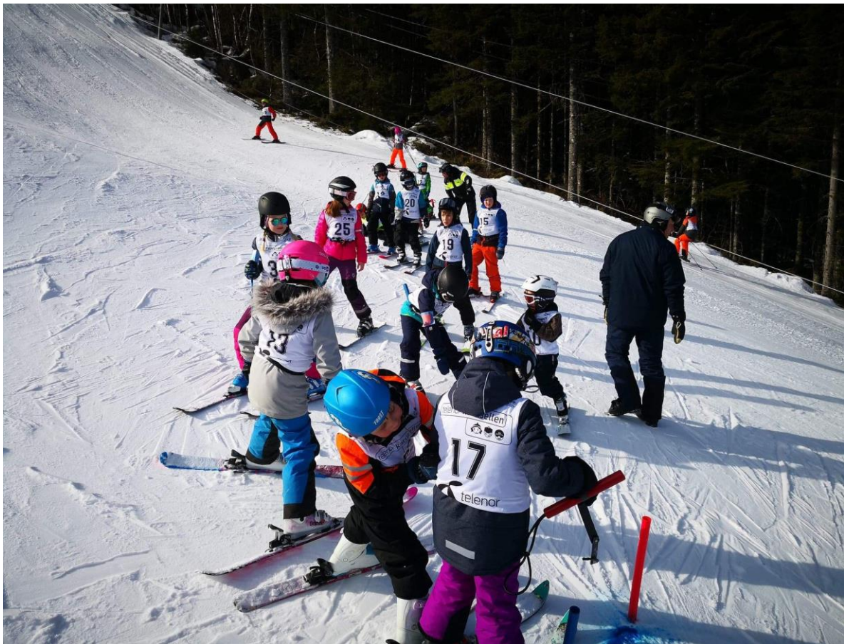
Illustrasjon 1: Slalomrenn i Årbergsdalen alpinsenter.

Nemndene har i 2019 hatt slik samansetjing: