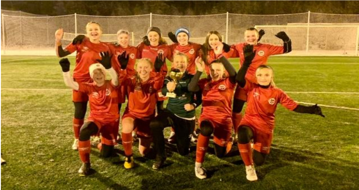
Ferske kretsmesterar ☺☺