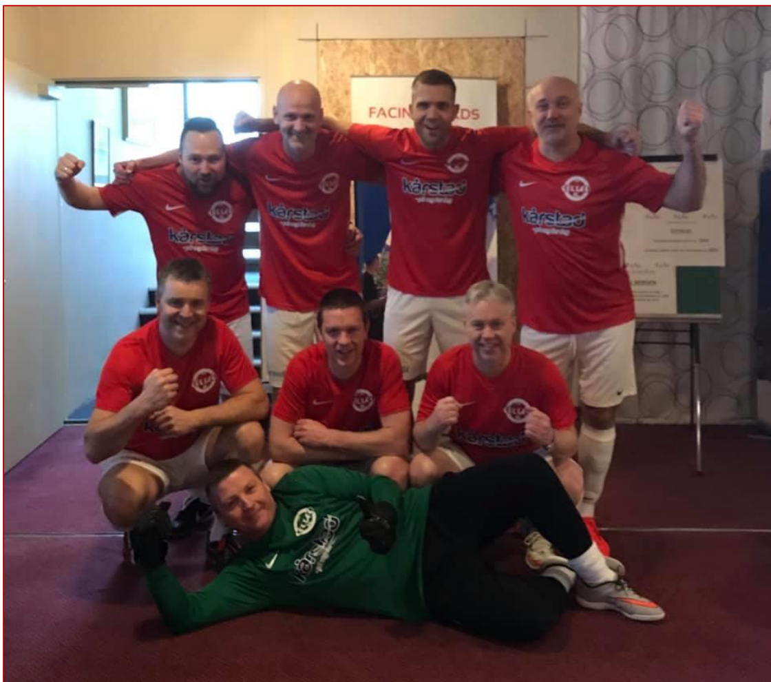
Oldboys-gutta på tur! Klubbens veteraner i aksjon i Lærdal. ☺