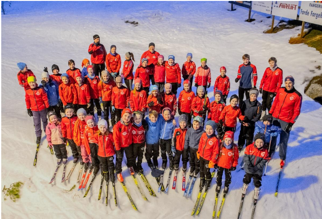
Flott Gaular-gjeng på skitrening.