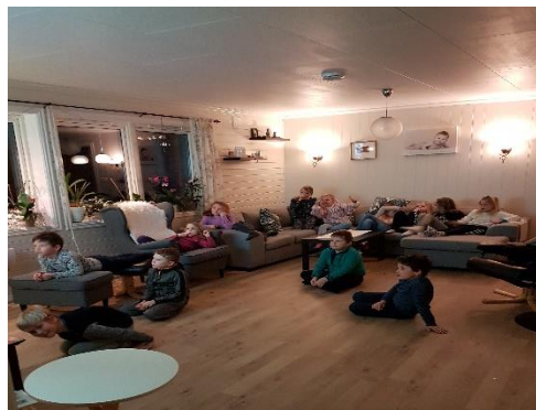
Sosial kveld på starten av 2019 når hallen var utleigd til andre

Hausten 2019 starta vi opp litt før haustferien, det var 24 barn som meldte seg for å vere med på handball, 23 som heldt fram etter eit par prøvetimar. Veldig kjekt at so mange vil vere med, men det krev meir trenarkapasitet og plass i hallen. Vi disponerar no 2 salar kvar trening, har fått med fast medtrenar og rullerar på foreldrevakter, 2 som hjelper til på kvar trening.