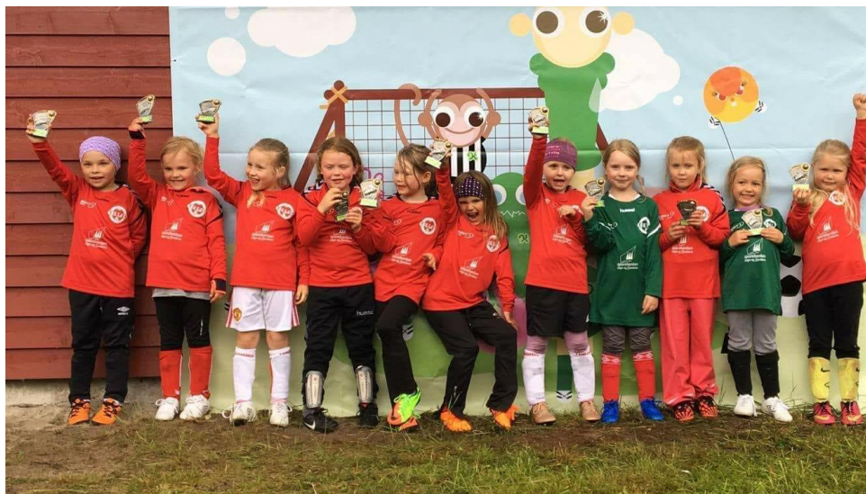
Deltatt på kongleriketturneringane. Samtrening med Bygstad (ein gong, i Osen)