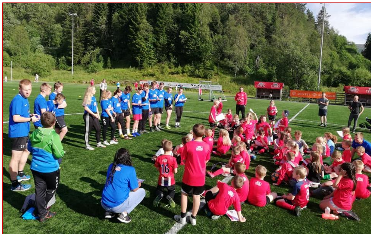
Sommerferien startet med TINE fotballskole i juni.