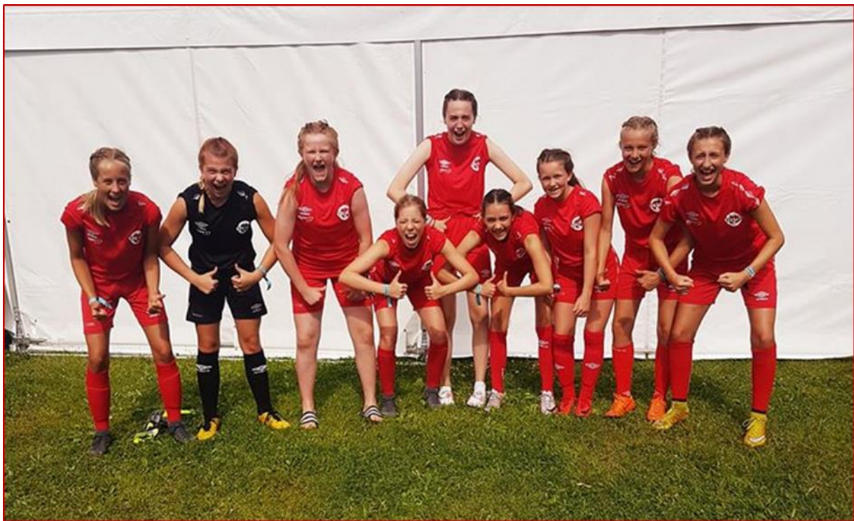
“Girl power” fra Gaular I Norway Cup.