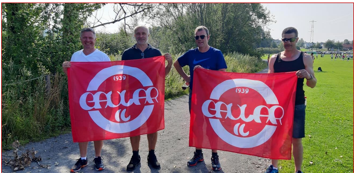
Gaular-flaggene i Norway Cup.