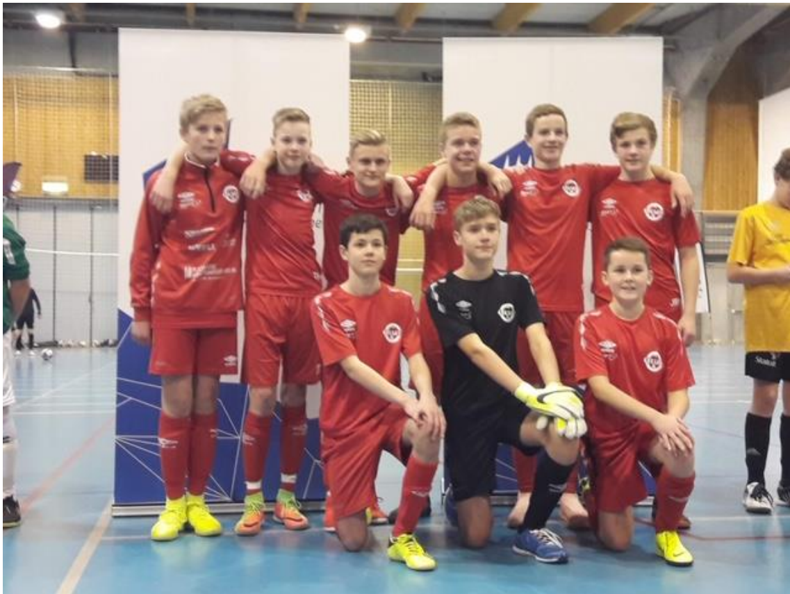
Stolte kara etter å ha vunne Førde cup.