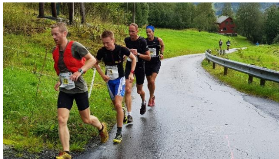
Biletet til venstre; Biletet til høgre;