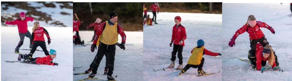
På skitringane er det mykje skileik!

I tillegg til dei faste trenarane, får vi god hjelp av foreldre og nokre av dei eldste deltakarane på langrennstreninga. Deltakartal på treningane var 50-55 totalt for alle aldersgrupper.