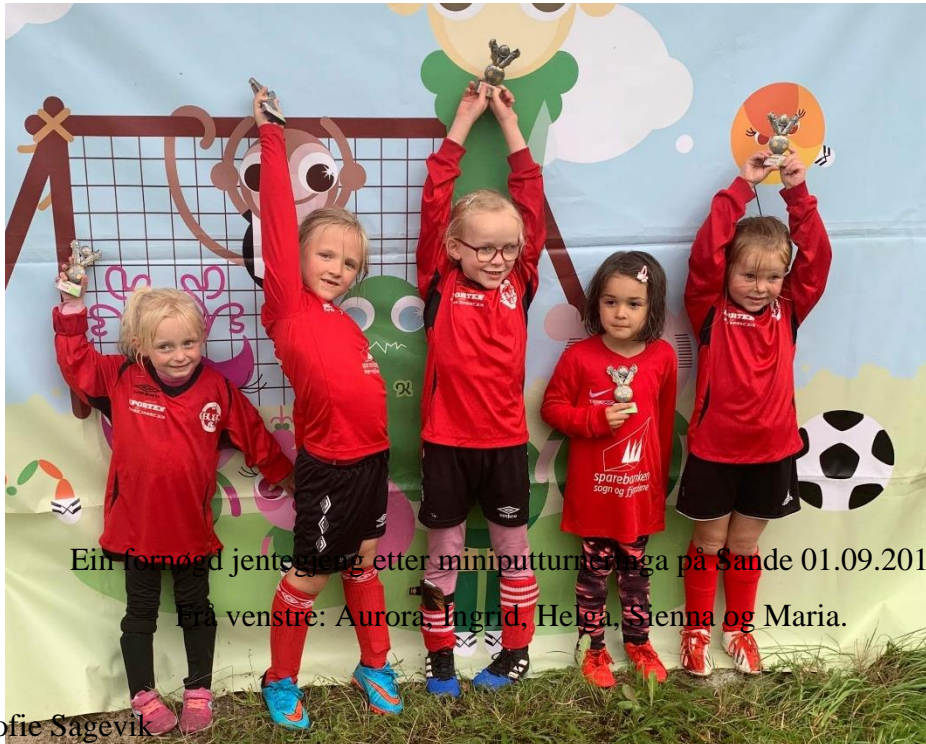
Ein fornøgd jentegjeng etter miniputtturneringa på Sande 01.09.2019.

Denne sesongen har 2013 jentene i Bygstad spelt alle 4 miniputt-turneringane. I vår sesongen var vi 4 stk, men på haustsesongen blei vi 5 stk, noko som var akkurat passeleg sidan vi har spelt 3- ar fotball. På treningane har oppmøtet vore veldig bra. Vi starta med treningane i mai i ballbingen på Bygstad skule, før Osen stadion blei klar. I vårsesongen når vi berre var 4 jenter, trena vi saman med 2012 jentene. Når vi vart 5 stk på hausten begynte vi å trene for oss sjølve. Jentene var ivrige på treningane og det var veldig kjekt å trene i bingane i Osen. Men jentene meinte at det aller kjekkaste var å spele turneringar, det var stas. Det var ein kjekk sesong med ein smilande, aktiv og lærevillig gjeng.