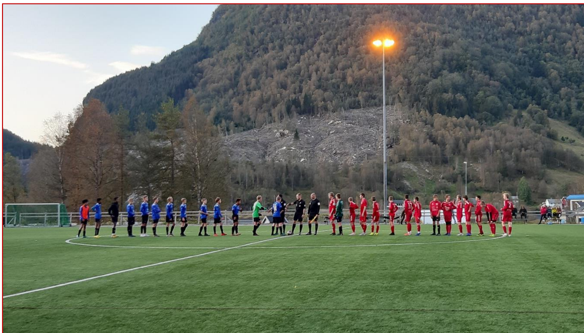
Fair Play-hilsen før guttelagets kamp på Sande stadion.